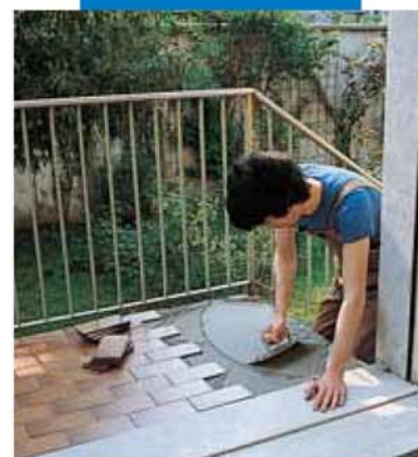
Гидроизоляция и укладка плитки с помощью смеси Kerabond T + Isolastic