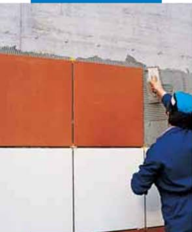
Укладка крупноформатной плитки с помощью Kerabond T + Isolastic