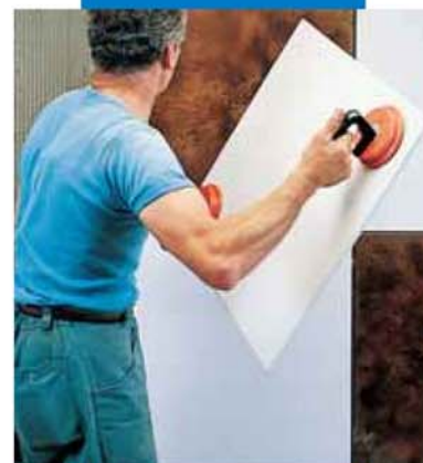
Укладка Keraion на стену