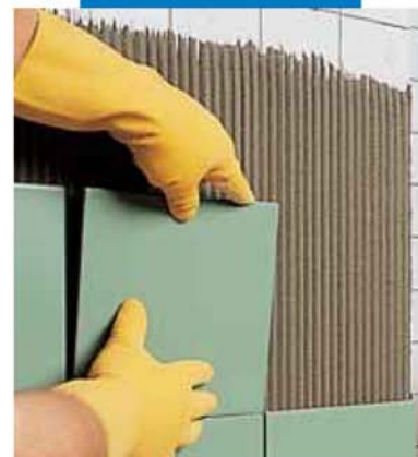
Нанесение поверх старой плитки