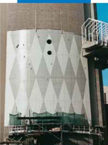
Пример укладки клинкера поверх бетона с помощью Kerabond T + Isolastic. Новая телекоммуникационная башня в Кувейт - сити (Кувейт)