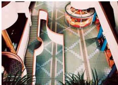
Фарфоровая неглазурированная плитка, укладываемая с помощью Kerabond T + Isolastic Общественное здание – Город Норс Йорк Онтарио (Канада)